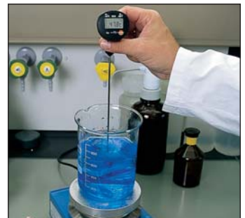
Contrôle de température en laboratoires

Le testo 905-T1 est l'un des mini-thermomètres les plus rapides avec une large étendue de mesure de -50 à +350 °C, à court terme (1-2 mn) jusqu'à +500°C. En particulier dans la plage de mesure élevée, le testo 905-T1 présente une bien meilleure précision que la plupart des autres thermomètres de cette catégorie. Incertitude type à 250°C pour des mini-thermomètres standards ±7,5 °C, pour le testo 905-T1 ±2,5 °C.