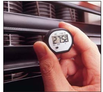
Mesure en chauffage et climatisation

Le thermomètre rapide d'immersion/pénétration est idéal pour les mesures de température dans l'air, les poudres et les liquides.