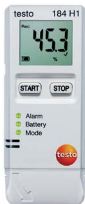
testo 184 H1