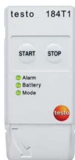
testo 184 T1

Aperçu des enregistreurs de données testo 184 .