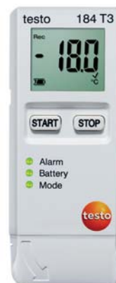
testo 184 T3