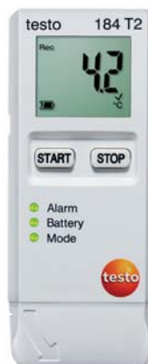
testo 184 T2