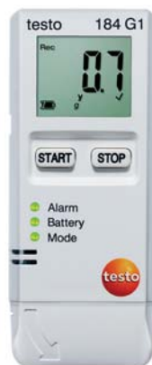
testo 184 G1