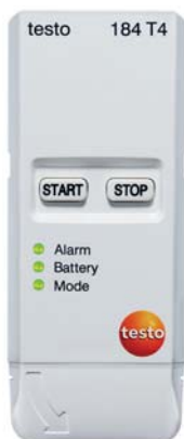
testo 184 T4