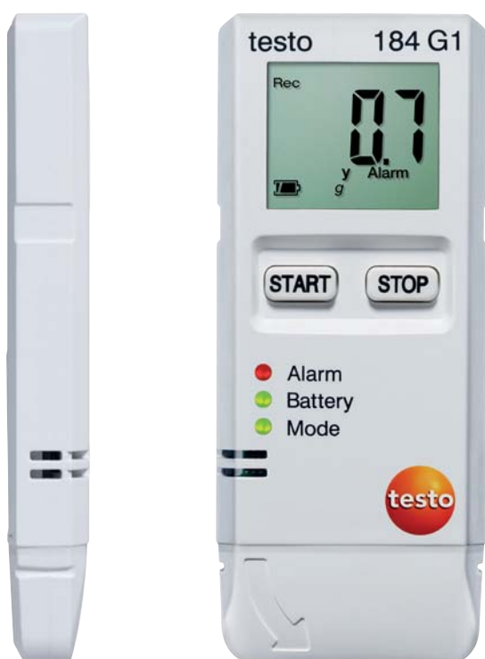
Illustration en taille réelle

Les avantages des enregistreurs de données testo 184.